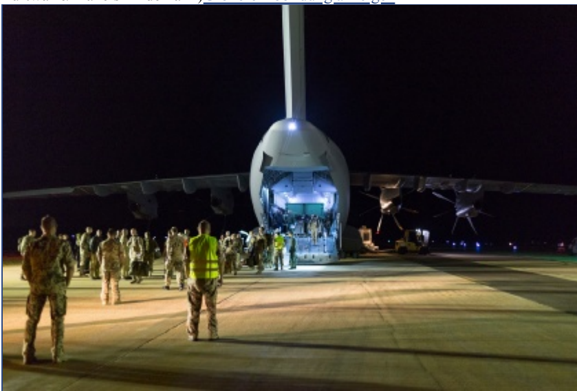
Mit rund 150 Soldatinnen und Soldaten nimmt die Luftwaffe an Blue Flag in Israel teil. Größere Abbildung anzeigen