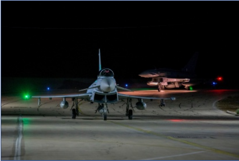
Die Eurofighter erreichen nach Zwischenlandungen in Italien und auf Kreta die Uvda Luftwaffenbasis in Israel. Größere Abbildung anzeigen