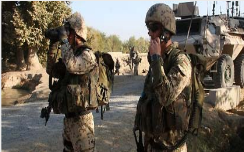
Minensuche an der Brücke Chahar Dara (Afghanistan)