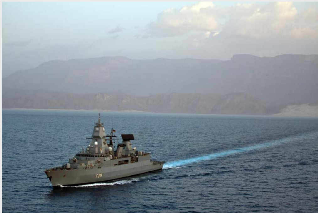
Einsatz ATALANTA: FGS Sachsen vor der Nordküste Somalias