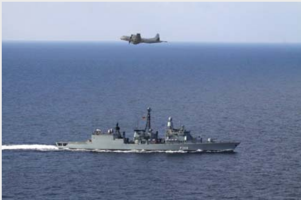
Atalanta: Fregatte NIEDERSACHSEN und Seefernaufklärer P-3C ORION