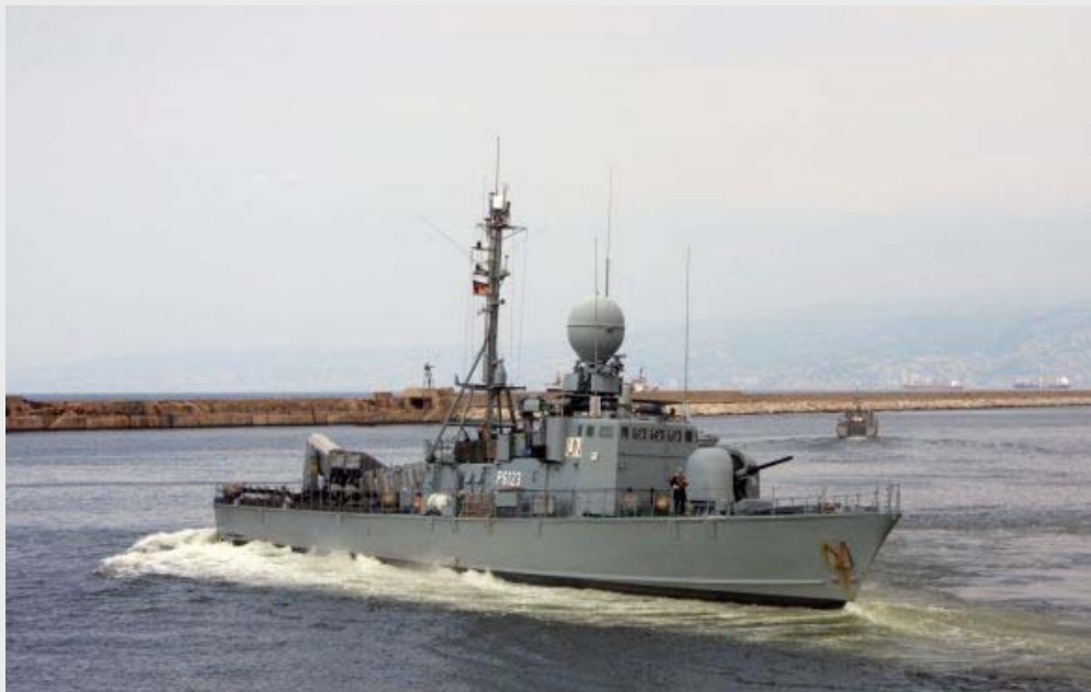
UNIFIL-Einsatz: Schnellboot HERMELIN