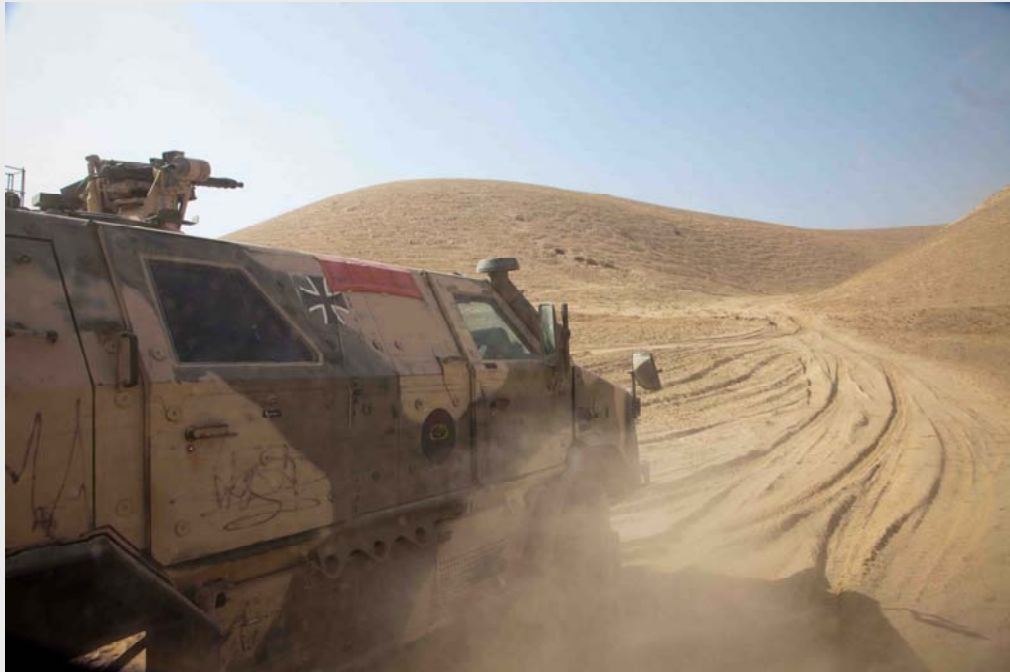
ISAF-Einsatz: Patrouillenfahrt in der Provinz Kunduz