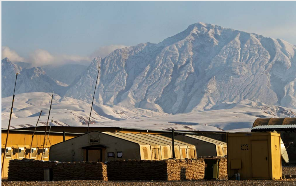
ISAF Einsatz: Eindrücke aus dem Camp Marmal im Regional Command (RC) North Mazar-e Sharif.