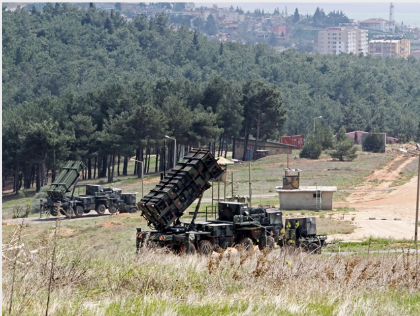
AF TUR: Waffensystem Patriot