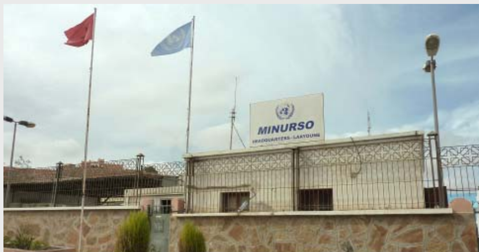
MINURSO: Headquarter