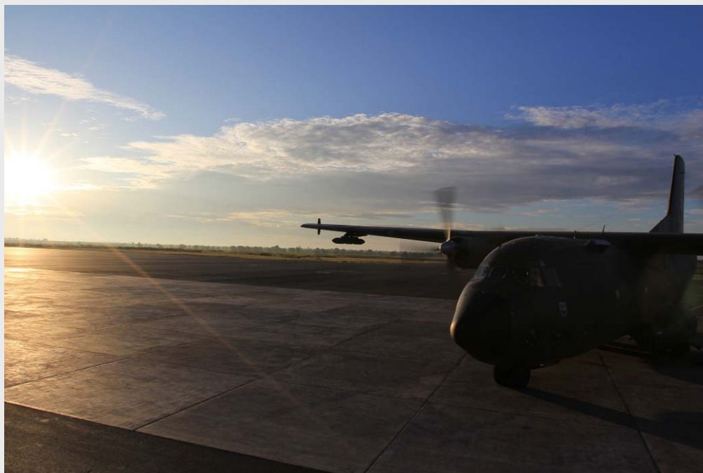
MINUSMA: Transall C-160