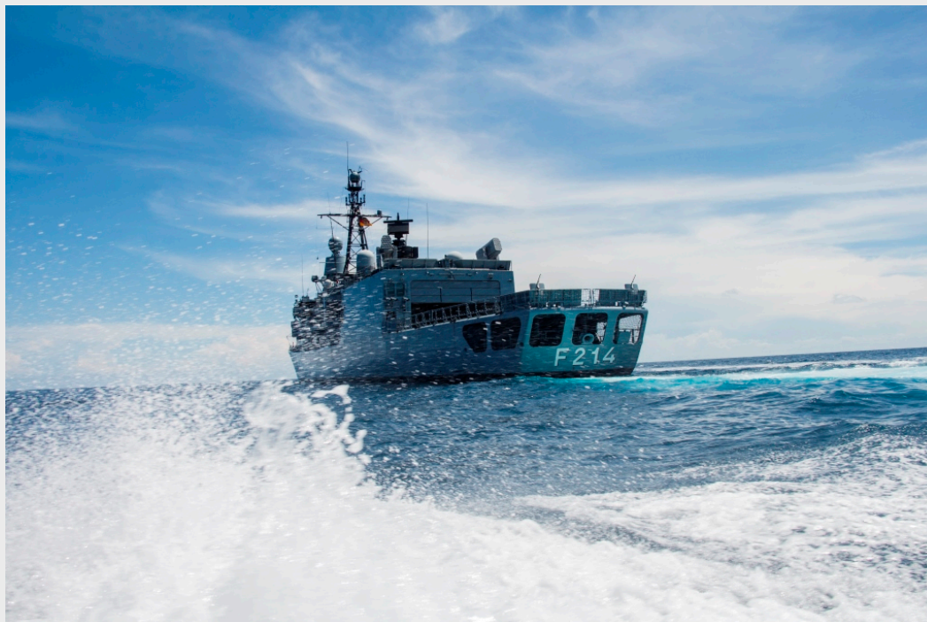
Atalanta: Fregatte LÜBECK im Golf von Aden