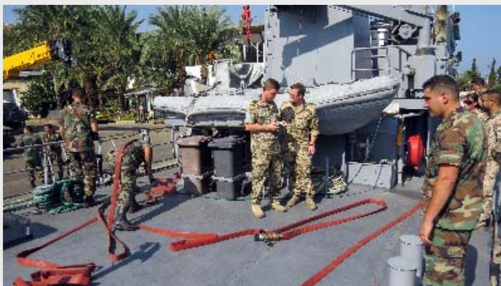
UNIFIL: Ausbildung libanesischer Marinesoldaten