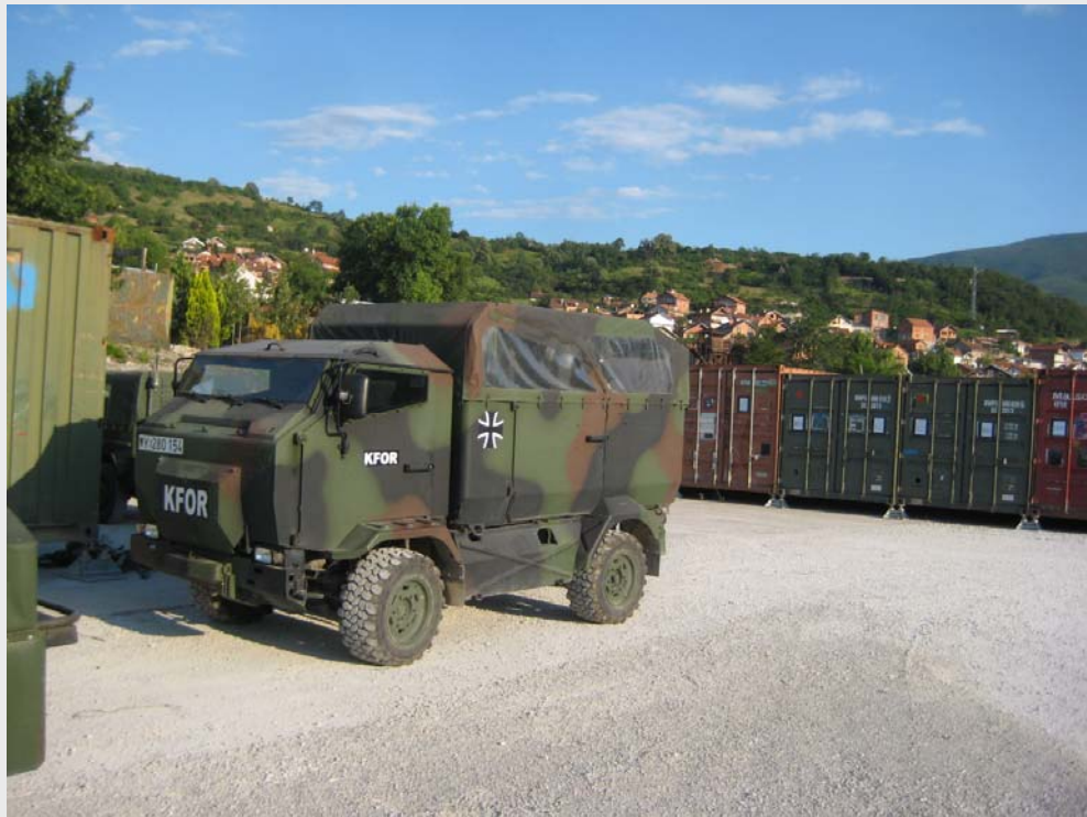
KFOR: Transportfahrzeug Mungo im Feldlager