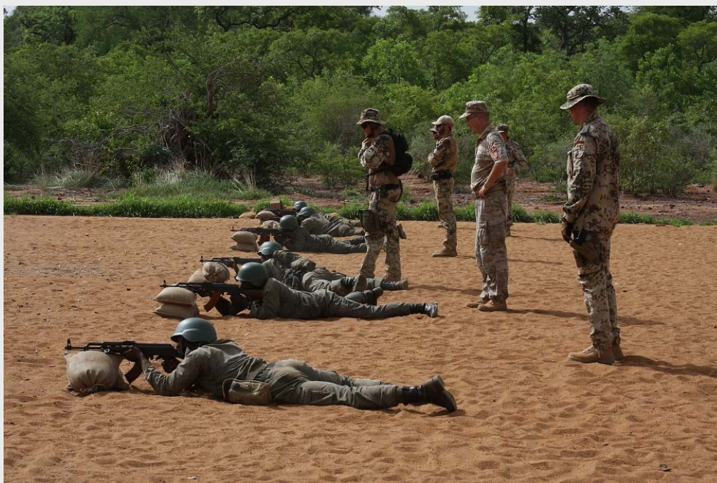
EUTM Mali: Schießausbildung