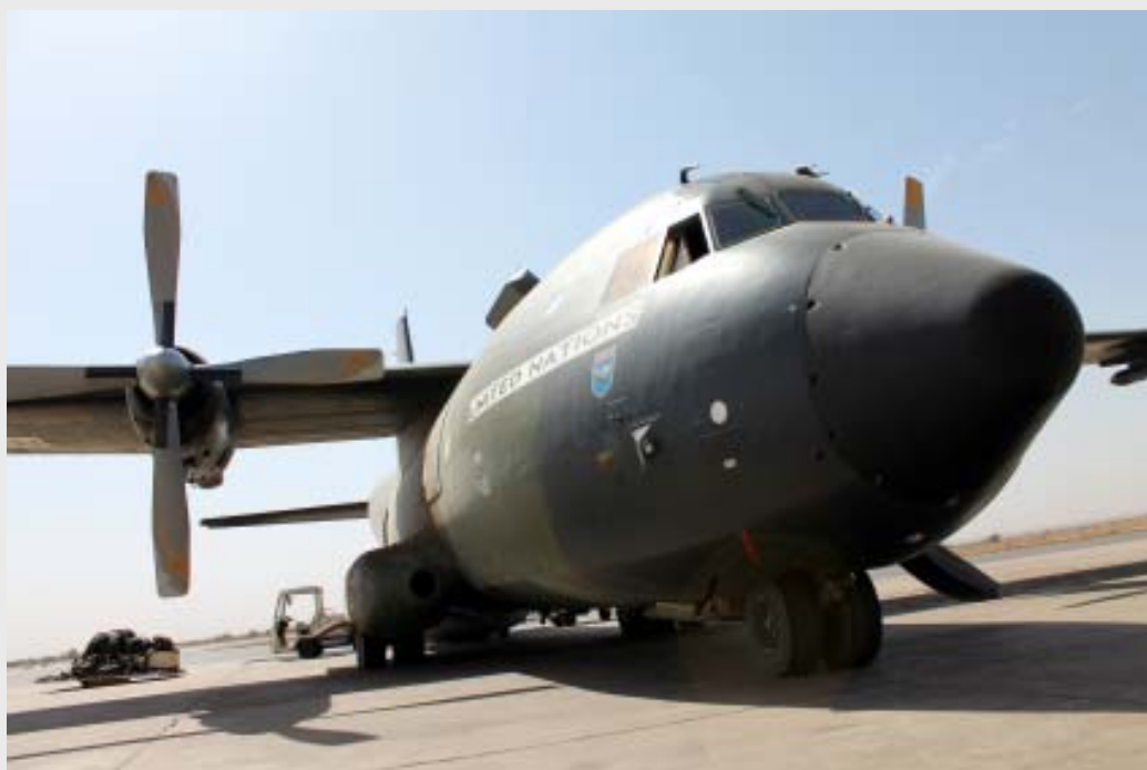
MINUSMA: Transall der UN auf dem Flugplatz von Bamako