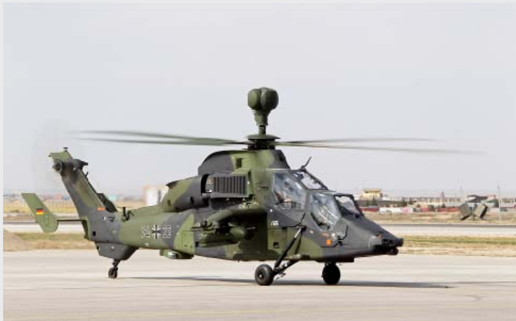
ISAF: Unterstützungshubschrauber Tiger