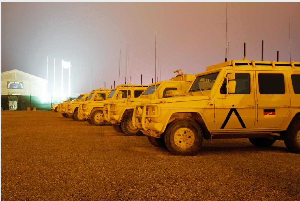
ISAF: Fahrzeugpool im Camp Marmal