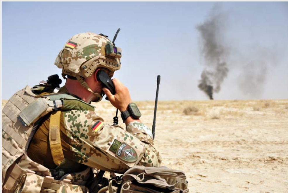
ISAF: Zielansprache durch das Joint Fire Support Team