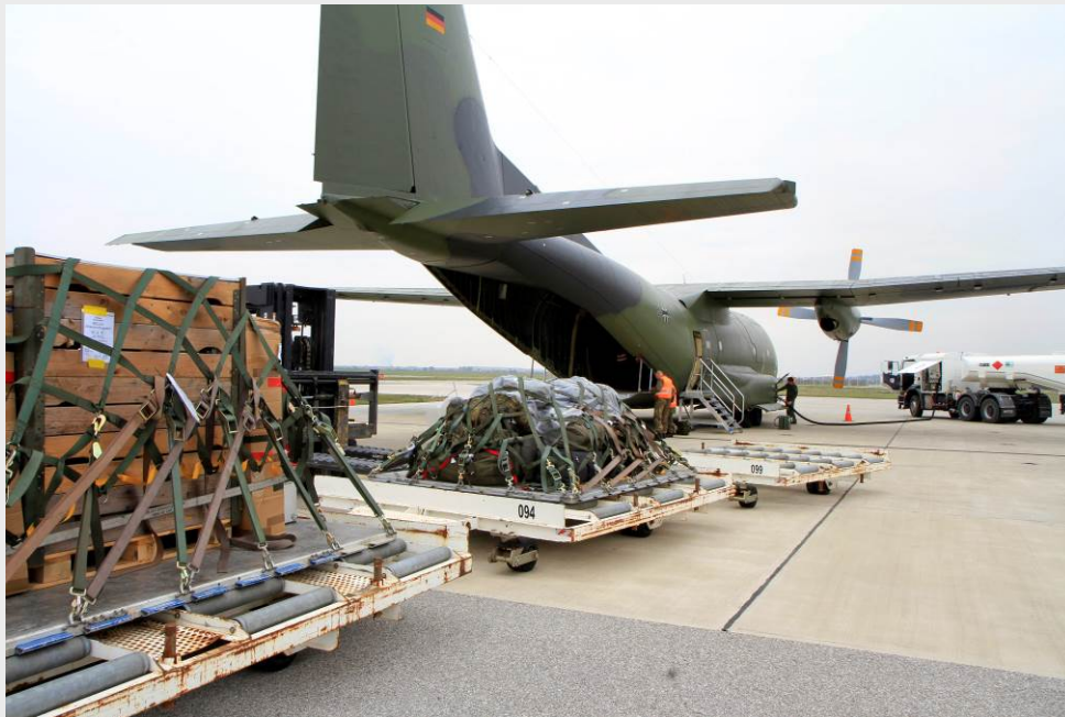
KFOR: Umschlag von Luftfracht auf dem Flugplatz von Pristina