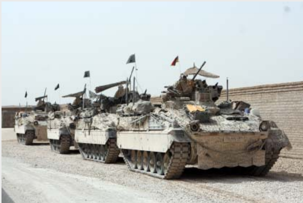
ISAF: SPz Marder vor der Rückverlegung aus Kunduz