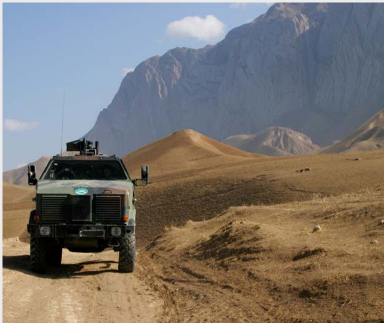
DINGO auf Patrouille bei ISAF