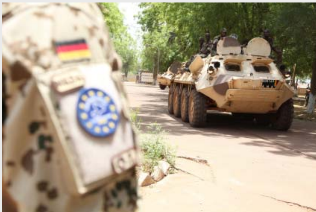
EUTM Mali: Pionierausbildung