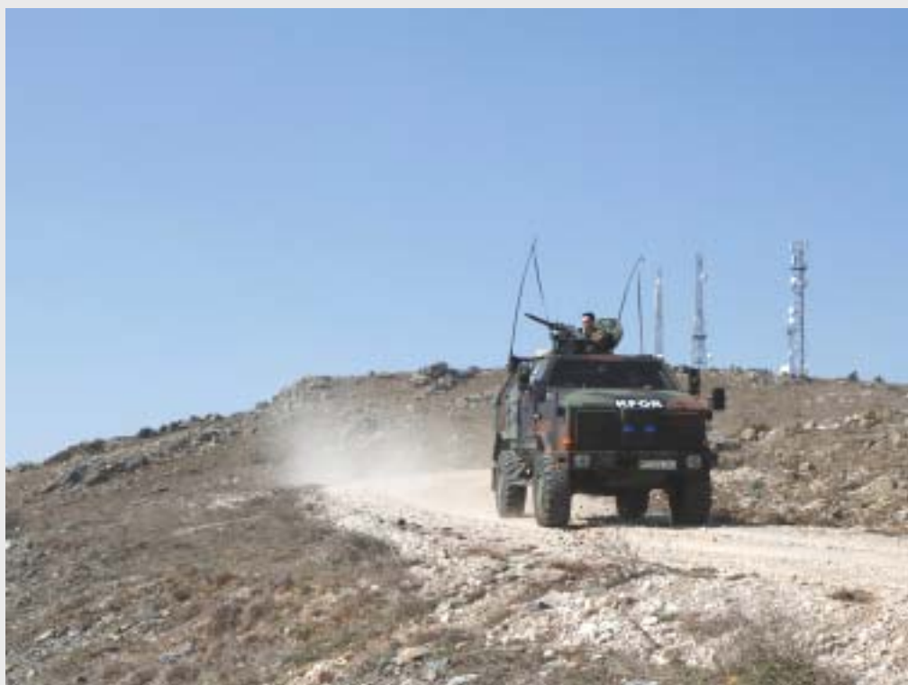
KFOR: DINGO auf Patrouille