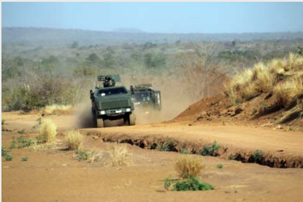
EUTM Mali: Übung Rettungskette – Ankunft der Schutzkomponente und des Beweglichen Arzttrupps