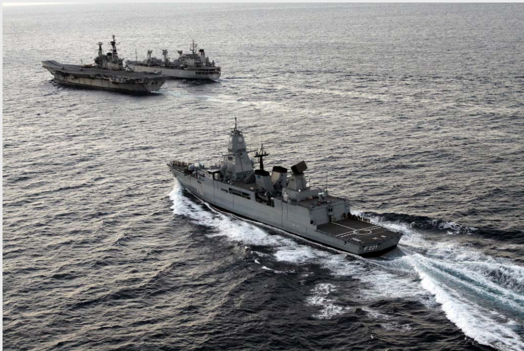
Atalanta: FGS HESSEN Vorbeifahrt am Flugzeugträger VIRAAAT und Versorger JYOTI