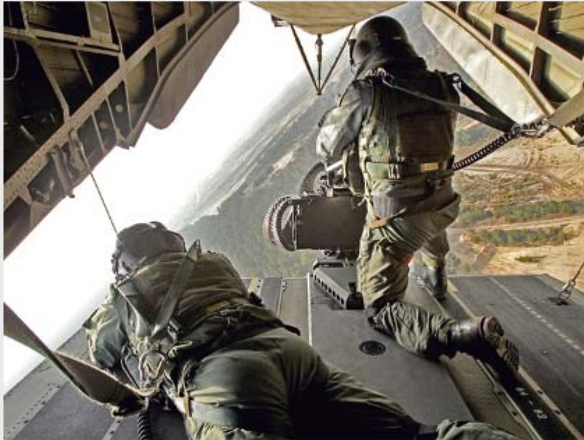
Bordschützen im Transporthubschrauber CH-53