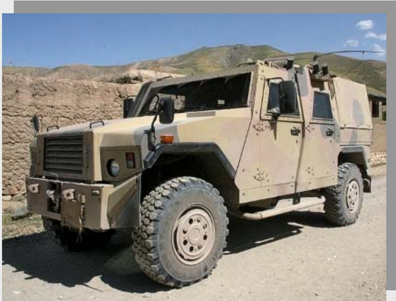
Der Eagle IV in Afghanistan

Die wöchentlich erscheinende zusätzliche Unterrichtung zur Lage in den Einsatzgebieten der Bundeswehr stellt einen weiteren Schritt zu mehr Transparenz im Rahmen der aktuellen Berichterstattung dar.